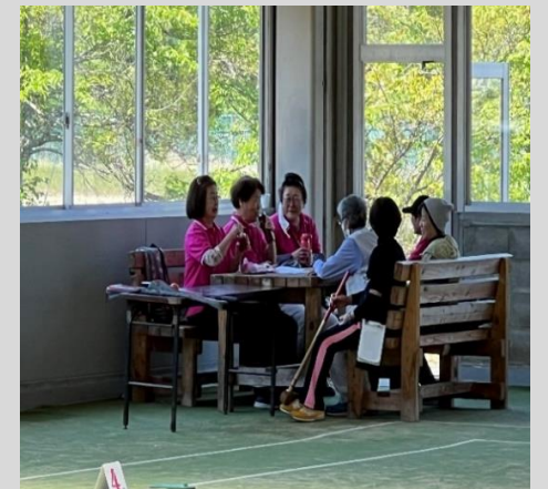
みんなでプレーしたり、お喋りしたり楽しく活動してます。 運動や息抜きにご参加してみたいはいかがですか？