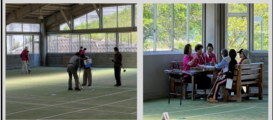
みんなでプレーしたり、お喋りしたり楽しく活動しています。運動や息抜きにご参加してみたいはいかがですか？