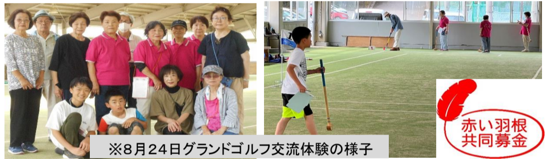
※8月24日グランドゴルフ交流体験の様子