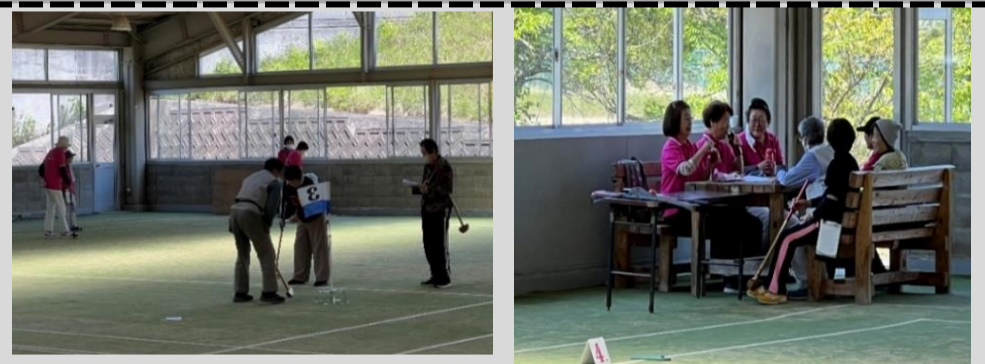
みんなでプレーしたり、お喋りしたり楽しく活動しています。運動や息抜きにご参加してみたいはいかがですか?

コロナウイルス感染症予防のため、参加される際はマスクを着用してください。天候、その他の理由により、実施日の変更、中止を行う場合がございます。参加希望の方は当日開始時間までに現地集合してください。 ★詳しいお問い合わせ先★ 高野町社会福祉協議会 生活支援コーディネーター 上西 TEL0736-56-2941