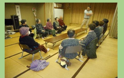
令和2年2月 明遍地区

あなたの地域でサロン活動を始めませんか? 活動希望の方は、高野町社会福祉協議会まで!! ※ふれあいサロン活動は現在コロナウイス感染症予防のため中止、延期している場合があります。※