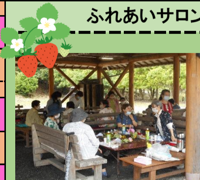
令和2年7月 なでしこ