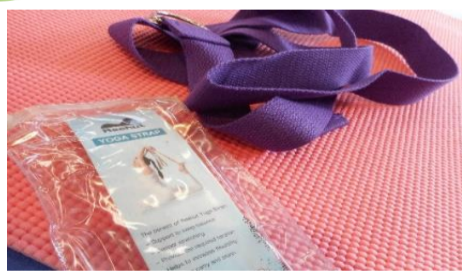
ヨガストレッチバンド

感染症対策を行い営業しております。感染拡大状況によっては営業を中止する場合がございます。