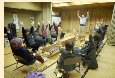
健康体操を行っています★