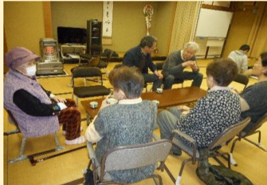
皆でお話をしています★★ 男性の参加者さんもいます。