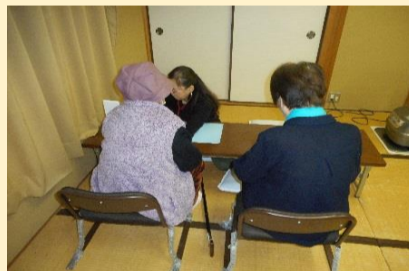
保健師さんによる健康相談★ 血圧測定をしている所です。