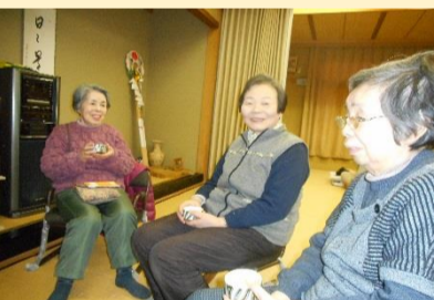
明遍以外からの参加者さん★

月に1回明遍通り集会所に集まっています。今回は、健康相談→昼食(お弁当)→健康体操を行いました。皆でお話をしたり、個別の健康相談を行ったり、身体を動かしたりして過ごしました！