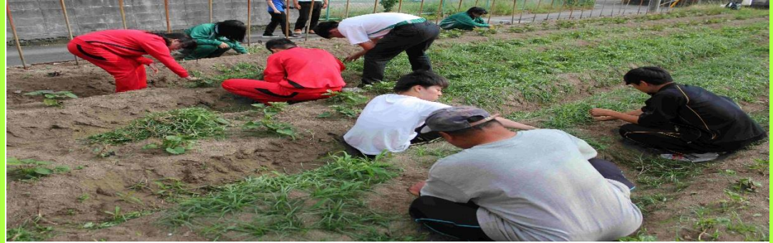
（高校生も手伝いに来てくれています。）

●詳しくは、「福祉わかやま・第361号（平成29年8月1日発行）」（インターネット）でご覧いただけます。 http://www.wakayamakenshakyō.or.jp/