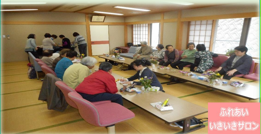
ふれあい いきいきサロン