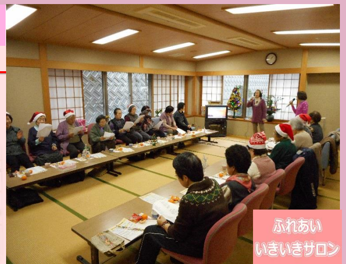
ふれあい いきいきサロン